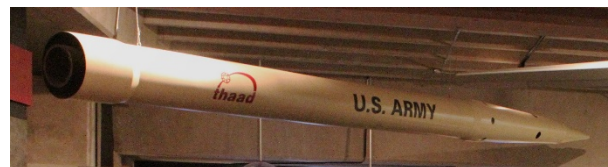
Figura 3 Missile THAAD

ha una capacità produttiva pari a 51 al mese, destinati a tutti gli acquirenti (Arabia Saudita con 11 batterie e 360 missili intercettori, per circa 15 miliardi dollari complessivi, ordinate a marzo 2019 e con consegne fino al 2026; Emirati Arabi Uniti con 2 batterie in servizio; Stati Uniti con circa 8 batterie) e la cui costruzione singola, tra assemblaggio, test e integrazione richiede mesi, rendendo la produzione limitata rispetto alla