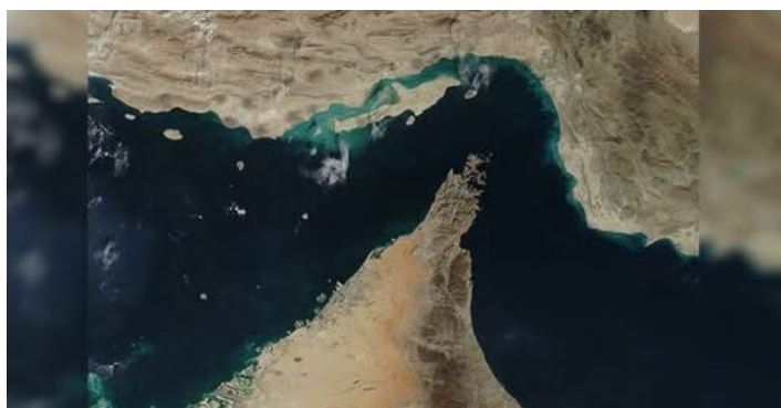
Figura 10 Lo stretto di Hormuz

mondo di laureati in discipline STEM - Scienza, Tecnologia, Ingegneria e Matematica - e le donne rappresentano circa il 60% della popolazione universitaria); la posizione geografica strategica (tra cui il controllo, assieme all’Oman, dello stretto di Hormuz, 54 km di corridoio largo 33 km.); le tante risorse naturali; una rete di