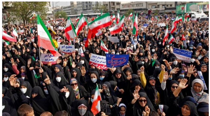
Figura 9 Proteste a Teheran nel 2026

Il fattore scatenante le proteste 2025-26 è stato dunque economico, a differenza dei precedenti movimenti incentrati su questioni particolari e libertarie (come quelle per l’obbligo dell’hijab).