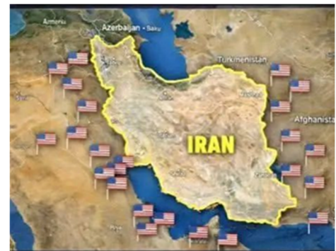
Figura 1 L'Iran, circondato dalle basi americane

domanda in contesti di conflitto (a causa della bassa velocità di produzione, la sostituzione degli intercettori utilizzati in combattimento può richiedere diversi anni). Da tenere presente che Israele 8 mesi fa (c.d. guerra dei 12 giorni) consumò da sola 150 thaad. Gli Usa ora hanno dirottato missili dall'Est (destinati alla difesa di Taiwan) al Golfo Persico e lasciato nel Pacifico 1 sola portaerei (delle 4 su 11 operative). In particolare, sono dirottati gli intercettori Thaad