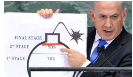
Figura 5 B. Netanyahu all'Assemblea generale dell'ONU - 2015

Nel marzo 2015, durante il suo ennesimo discorso al Congresso degli Stati Uniti, invitato dai Repubblicani senza previo accordo con la Casa Bianca, Benjamin Netanyahu attaccò duramente Obama, dicendo cose molto dure sull'accordo che l'amministrazione di Barack Obama stava tentando di trovare con il governo iraniano guidato dal Presidente Hassan Rouhani, nel chiaro tentativo di far saltare le trattative. Anzi, oltre a mobilitare gli Ebrei americani contro l'intesa, alcuni reports riferiscono che, per sabotare le trattative, Israele abbia tentato di divulgare dettagli dei negoziati ed abbia fabbricato prove dell'avvicinamento dell'Iran all'atomica. Nel successivo famoso discorso all'Assemblea Generale delle Nazioni Unite (quello in cui mostrò un cartello su cui era disegnata una bomba, divisa schematicamente in alcuni stadi), Netanyahu spiegò che mancavano pochi mesi all'atomica iraniana (ormai una barzelletta!) e che Israele non avrebbe consentito all'Iran di andare oltre un certo punto nello sviluppo dei suoi armamenti atomici. L'ossessione, come l'abbiamo definita, si è protratta fino ai giorni nostri e si sta implementando nei vari teatri di guerra aperti da Tel Aviv.