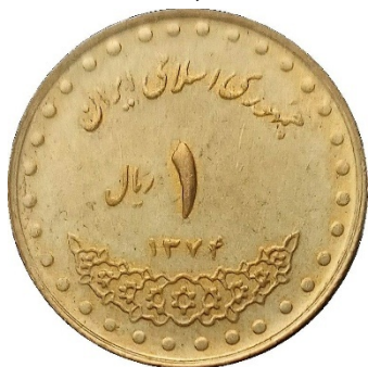
Figura 8 Un riyal iraniano

Nel pieno di sabotaggi, corruzione ed un'economia in declino, provata da 40 anni di sanzioni internazionali, lo scorso anno è iniziata una forte e mirata pressione esterna sul riyāl, provocandone il crollo (il cambio è ai minimi storici con circa 1,3 milioni di riyāl per dollaro statunitense, con un calo di circa il 20 per cento nel solo mese di dicembre '25), che ha