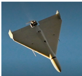
Figura 2 Drone iraniano Shahed

Si dice che nel primo giorno di attacco gli USA abbiano impiegato circa il 10-15% dei missili a loro disposizione. È stato calcolato che, a questo ritmo, in 4 settimane di guerra