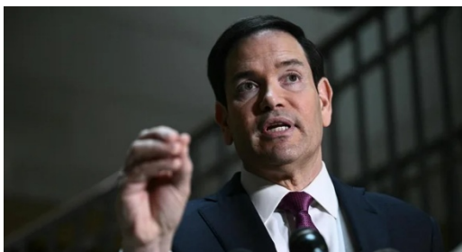
Figura 3 Il Segretario di Stato Marco Rubio mentre cerca di spiegare le motivazioni dell'attacco all'Iran

In tutto questo, cosa ci guadagnano gli USA? È la domanda che si stanno facendo anche molti Americani, persino al Pentagono. E l'apparente mancanza di una strategia, il racconto