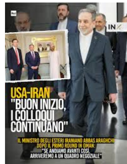
Figura 6 La copertina di "in 1/2 ora" di Rai 3 sulle trattative USA-IRAN-OMAN

Fu proprio Trump a rottamare, nel 2018, l'Accordo del 2015 sul programma nucleare iraniano (Joint Comprehensive Plan of Action), dopo un negoziato durato ben 10 anni, e che conteneva clausole tecniche molto stringenti per garantirne il carattere esclusivamente civile (come il limite massimo di arricchimento dell'uranio al 3,67%; cessato l'accordo, l'Iran aveva superato il 60%). E ne seguirono nuove e più pesanti sanzioni per gli Iranian, che fecero loro definitivamente percepire l'immagine degli Stati Uniti come la minaccia diretta alla propria sopravvivenza. Questo ha favorito il rafforzamento della