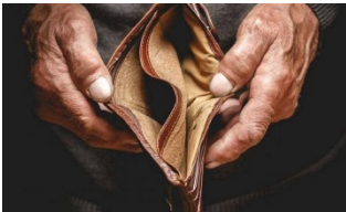
Figura 11 Le conseguenze per gli Italiani

Il Codacons calcola che la "guerra di Trump" (o meglio, della c.d. "coalizione Epstein"), costerà agli Italiani (come sempre, non tutti) i seguenti importi annui: 165 euro di carburante, 380 euro per luce e gas, 93 euro per beni alimentari, 180 euro per trasporti = totale 818 euro annui per famiglia.