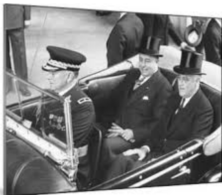
Figura 4 Franklin Delano Roosevelt con il dittatore nicaraguense Anastasio Somoza García